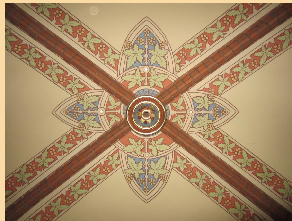
Gewölbe und Säulenkapitelle im nördlichen Seitenschiff vor und nach der Restaurierung