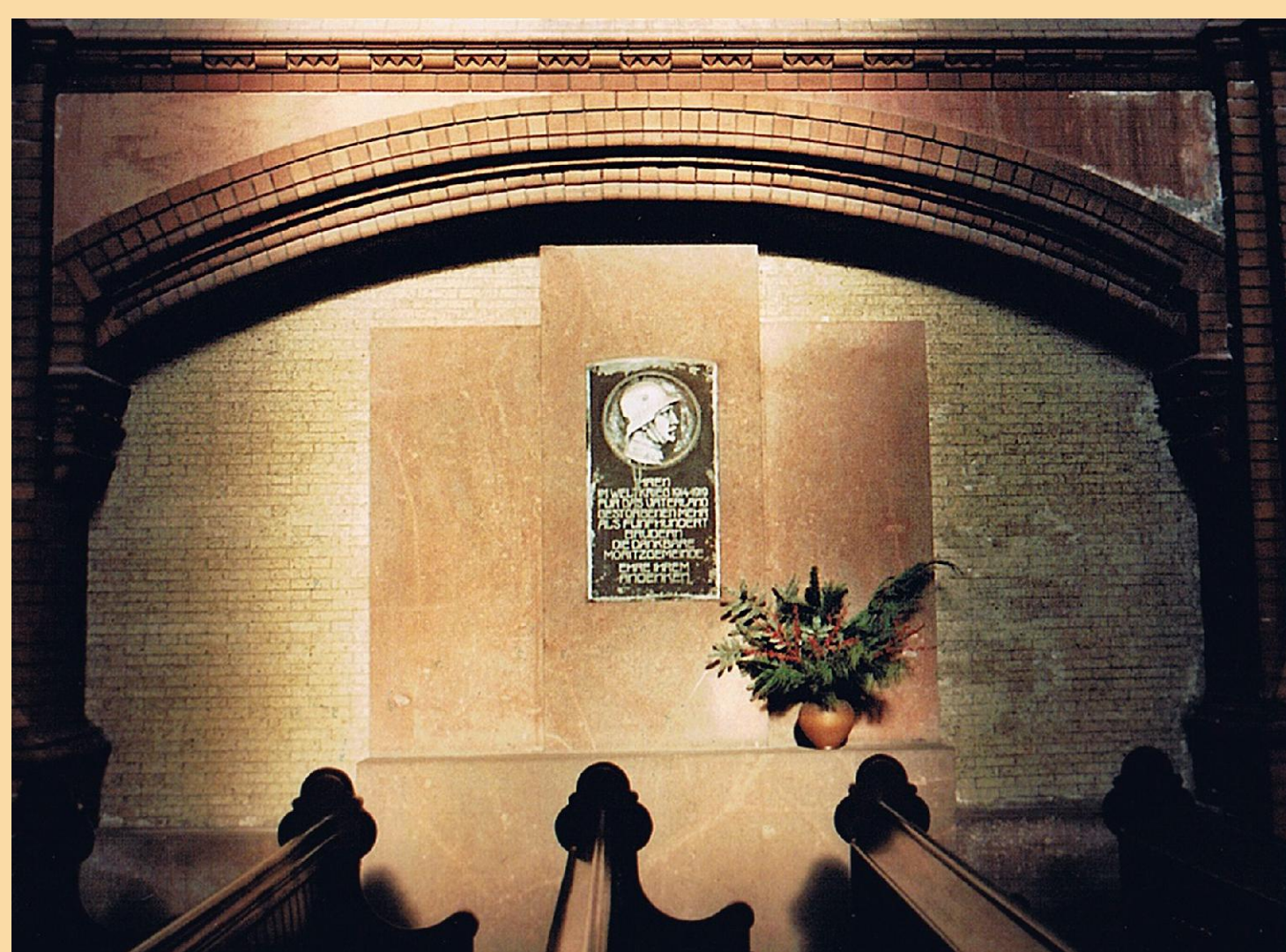
Auch das Umfeld des Mahnmales wurde neu gestaltet.