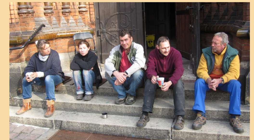
Das Team der Restaurierungswerkstatt Brasche gönnt sich eine Pause in der Oktobersonne.