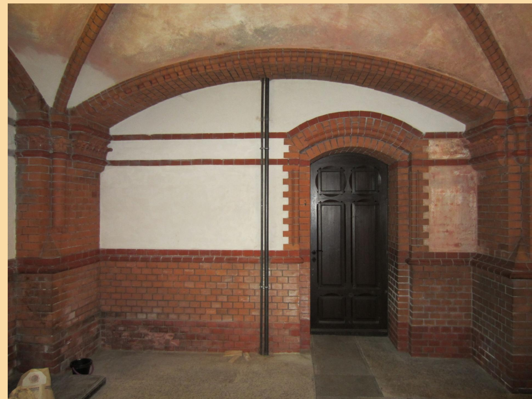
Blick ins Seitenschiff vor und nach der Restaurierung