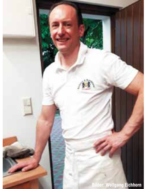
Bilder: Wolfgang Eichhorn