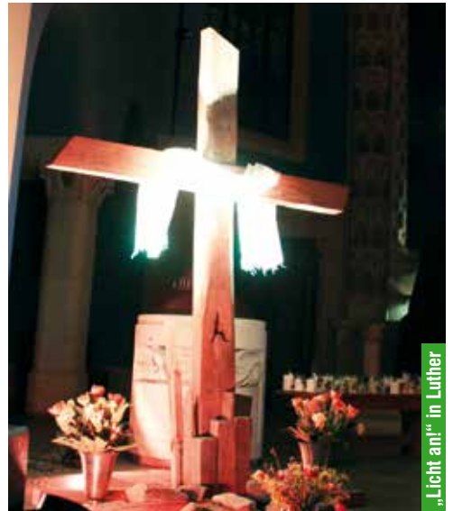
„Licht an!“ in Luther