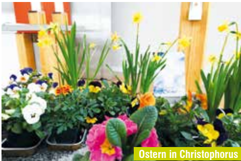
Ostern in Christophorus