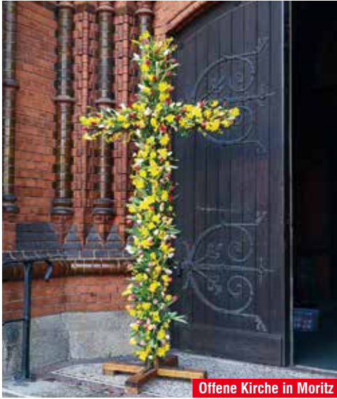
Offene Kirche in Moritz