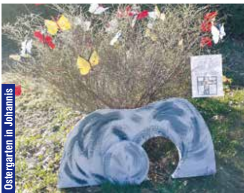
Ostergarten in Johannis