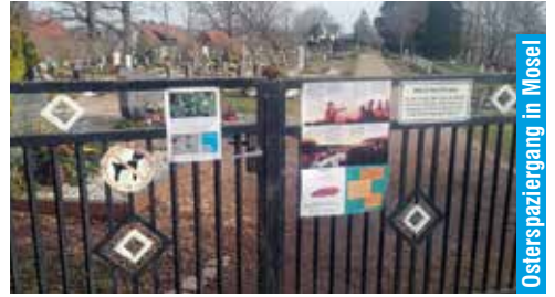
Osterspaziergang in Mosel