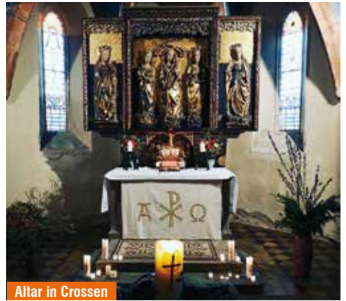
Altar in Crossen