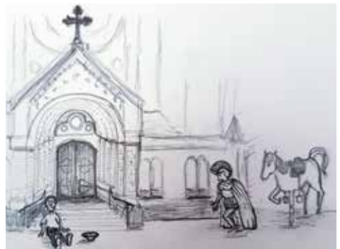
Zeichnung: Anja Müller

Einen Laternenumzug kann es in diesem Jahr wegen der Corona-Auflagen leider nicht geben, aber bringt bitte trotzdem eure Laternen mit.