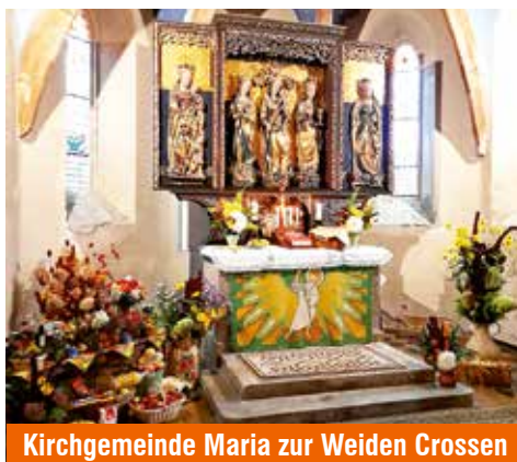
Kirchgemeinde Maria zur Weiden Crossen